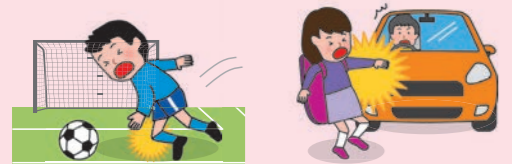
● 団体活動中のケガ ● 団体活動への往復中、車にはねられてケガをした場合

※AW・BW・CW区分にご加入の場合は、上記に加え、「団体での活動中およびその往復中」以外の事故も対象となります。ただし、熱中症、細菌性・ウイルス性食中毒を除きます。